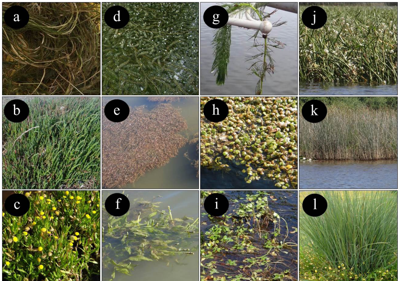
Figura 1. Macrófitas acuáticas representativas de los humedales Punta Teatinos, Región de Coquimbo, centro-norte de Chile y río Cruces, Región de Los Ríos, centro-sur de Chile. (a) Stuckenia pectinata , (b) Sarcocornia fruticosa , (c) Cotula coronopifolia , (d) Egeria densa , (e) Potamogeton pusillus , (f) Potamogeton lucens , (g) Myriophyllum aquaticum , (h) Limnobium laevigatum , (i) Ludwigia peploides , (j) Sagittaria montevidensis , (k) Schoenoplectus californicus , y (l) Juncus balticus .